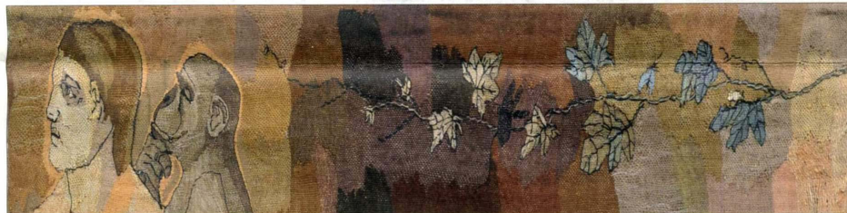
Aino Kajaniemi: Európa szövete, 20. részlet, 2010 szövött kárpit, 102,5x21 cm

Nem mintha a kiállítás többi darabja nem lenne önálló mű, sőt éppen ez